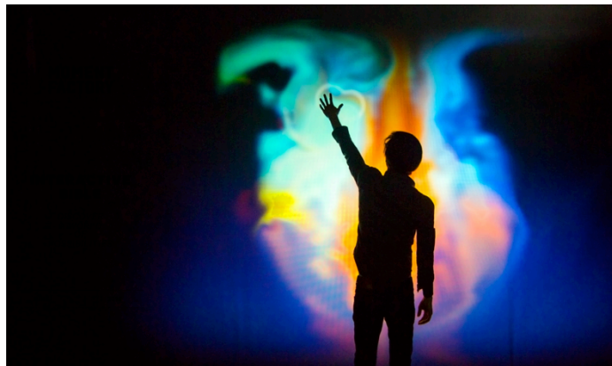
Moment Factory | Protoroom