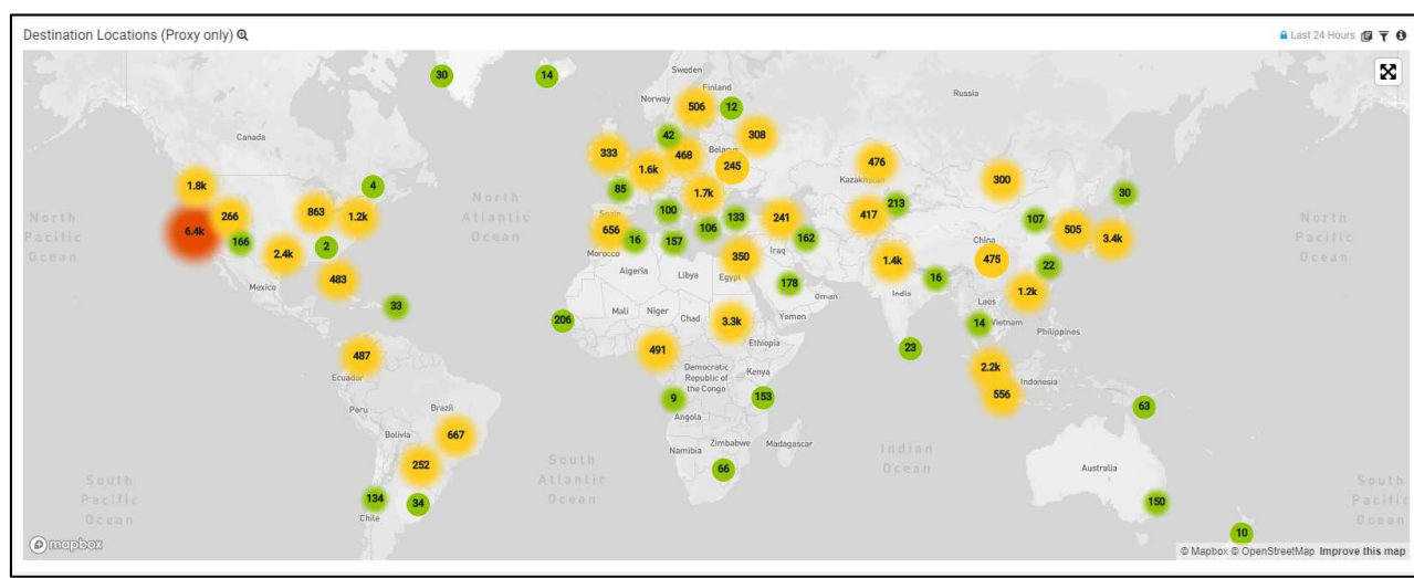
▲「Sumo Logic」ダッシュボード画面イメージ2