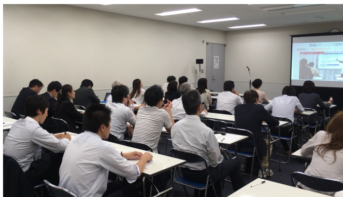
5/17(木) EDIX内 当社無料公開セミナーの様子

EDIXの3日間、当社出展ブースには、企業の研修ご担当者様や学校などの教育関係の皆様にご来場いただき、数多くのお立ち寄りいただきました。低コストで誰でも簡単に使えるeラーニングシステムや、動画を使った効果の高い社員教育サービス、動画講座制作・活用のポイントなどについて、セミナーやデモンストレーションでご案内いたしました。また、様々な研修会社のコースから目的・予算で選べる「AirCourse研修ナビ」を初披露しました。サービスの提供開始は7月です。