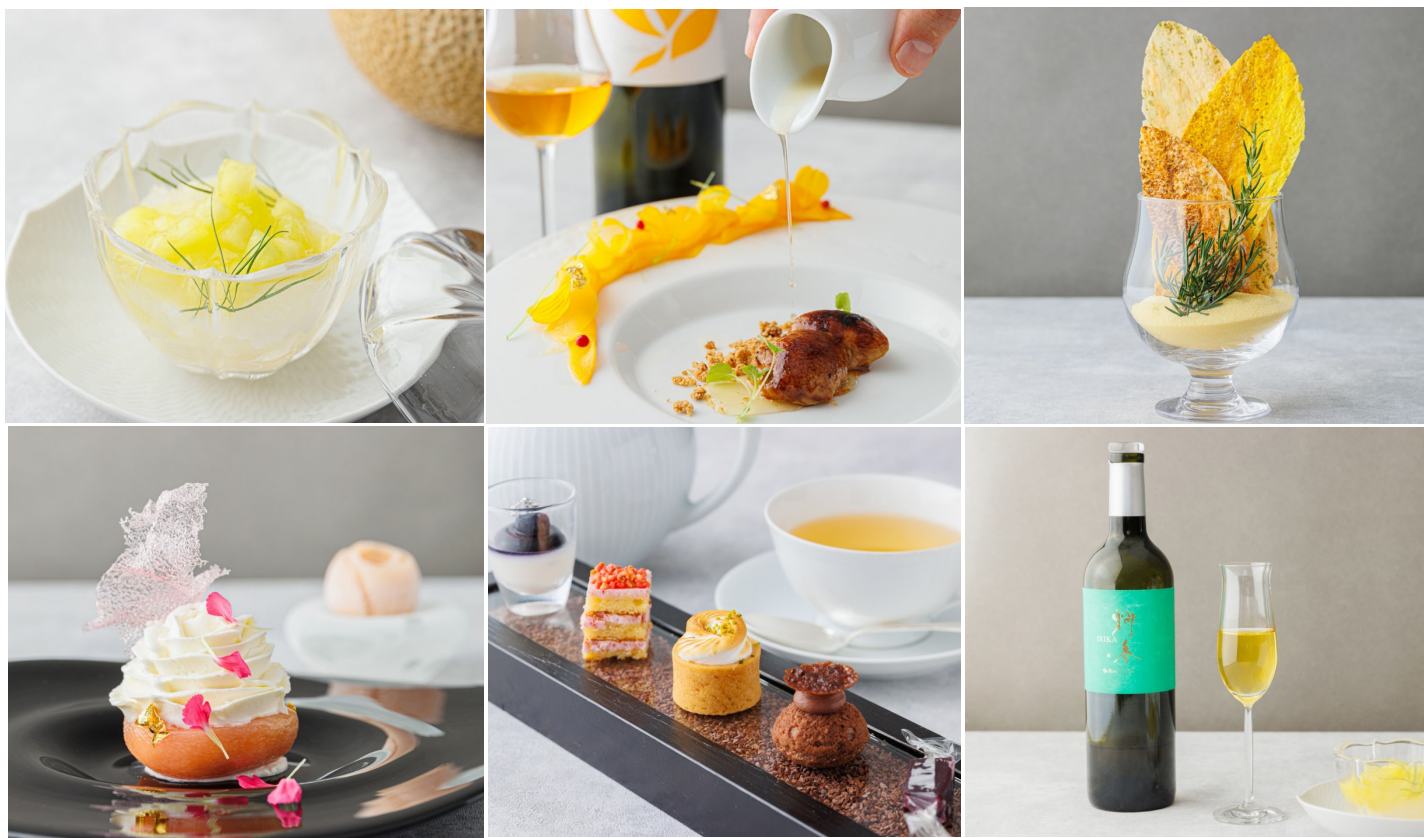
※画像はイメージです。

2023年7月10日（月）より、フレンチレストラン [アッシュ] にて今話題のデザートコースのご提供がスタート。細部にまでこだわった華やかで上品なスイーツを1枚の皿に美しく盛り付けた「アッシュデザート」をコース仕立てで楽しめます。優雅なデザート体験をご堪能ください。