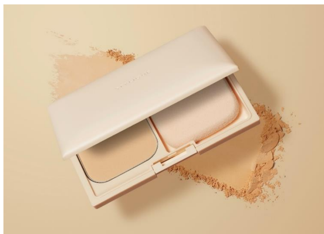
商品名：スタイリーク パウダー ファンデーション (全6色) レフィル+スポンジ 価格：3,000円(税抜) 3,300円(税込) ケース 価格：1,000円(税抜) 1,100円(税込) お客様からの問い合わせ先 お客様相談窓口 0120-71-9000

当社では、今から35年前に保湿効果の高い可溶性コラーゲンを純粋な形で100%粉末化することに成功し、1989年発売のベースメイクブランド「スタイリークII」に配合しました。ベースメイクは肌色を補正したり、肌の悩みをカバーするだけのものと考えるのが一般的な時代、当社は「W(wash/洗う) C(conc/ふきとり・除く) C(conditioning/整える) -C(creme/与える) F(foundation/守る)」とファンデーションまでがスキンケアであるという美容理論を打ち立てています。当社のパウダーファンデーションはこれまで、水分にオイル成分とパウダーを混ぜるという方法で開発することが一般的でしたが、今回初めて保湿美容成分(BG)とパウダーを混ぜたムース状のスラリーをベースにした「ふんわりシフォンタッチ製法」で、ふわっと柔らかな空気感を抱えこんだパウダーファンデーションの開発に成功しました。スポンジでファンデーションを取るときにすると柔らかな取れ心地は、肌の上に伸ばした時もそのままにするするとしたつけ心地が続きます。