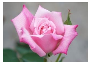
レディラック (ナリスローズガーデン)