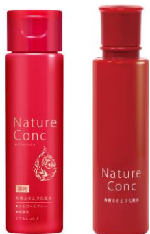
左：現在のパッケージ 右：新パッケージ

当社の調査では、一般的にふきとり化粧水は、老化角質を取り除くケアであるため、刺激が強いというイメージを持っている人が多く存在します。「ネイチャーコンク」は、90年近く続く角層研究をもとにハトムギや月見草など植物由来の保湿成分のチカラで毎朝晩気持ちよくケアできることが健やかな肌に導く秘訣です。今回新しく敏感肌の人の協力によるパッチテストを実施しクリアしています。美白※3・ニキビ予防・肌あれ防止に加えて、毛穴のざらつきケアまでできる「ネイチャーコンク」。実は朝の洗顔代わりに使用することができ、使用者や使用シーンに広がりが生まれています。今回のリニューアルは医薬部外品をイメージしやすいパッケージに刷新。敏感肌の人も含めてより多くの人の肌悩みにこたえるブランドに育てていきたいと考えます。※3 メラニンの生成を抑え、シミ・そばかすを防ぐ。