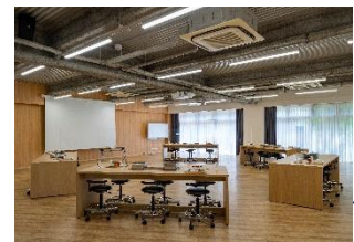
2021～ 兵庫研修センター