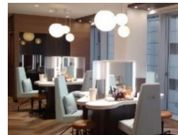
2017～ 「ナリス ビューティサロン」