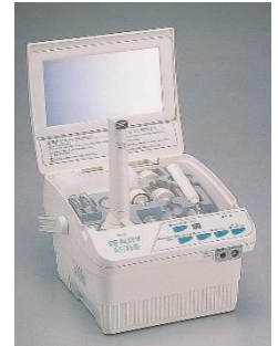
1999 「ビューティエステ」