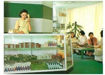
1974 「ナリス スキンケアサロン」