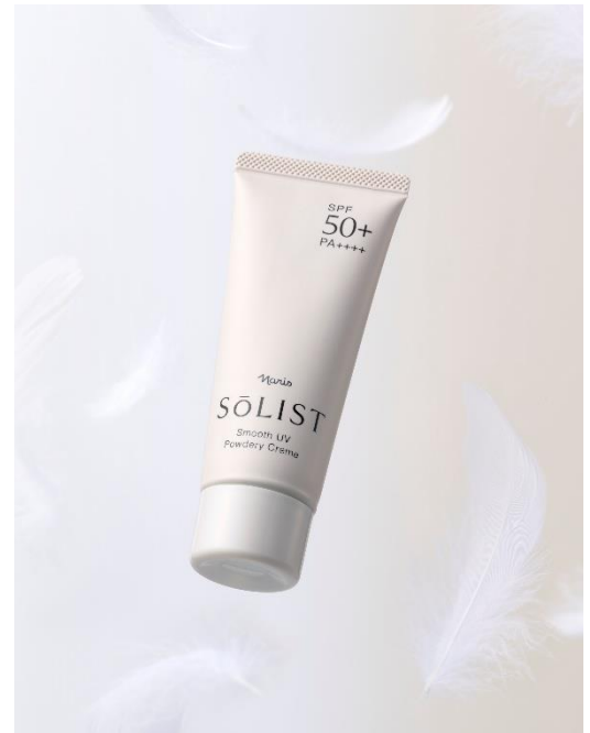
商品名：ソリスト スムース UV パウダリークリーム 容量：60g 価格：1,600円(税抜) 1,760円(税込) お客様からのお問い合わせ先：ナリス化粧品 お客様相談室 TEL:0120-71-9000

「ソリスト」ブランドは、日焼け止めの基本機能である「日焼けしない」にプラスアルファの価値を提供することをコンセプトにスキンケア効果を提供してきました。今回の新製品「スムース UV パウダリークリーム」は、スキンケア効果はもちろんのこと、新たなプラスアルファの機能として「とにかくサラサラで心地よく塗り直しができる」ことを提供。猛暑で高湿度の日本の長い夏を快適に乗りきるための日焼け止めです。