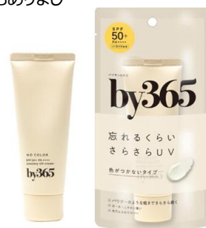
リニューアル前のパッケージ

【本件に関するお問い合わせ先】 株式会社 ナリス化粧品 経営企画室 広報 横谷(よこたに) 〒553-0001 大阪市福島区海老江 1 丁目 11 番 17 号 TEL:06-6346-6672 FAX:06-6346-6569 E-mail:narispr@naris.co.jp HP:https://www.narisup.co.jp