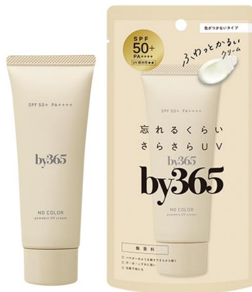
by365（バイサンロクゴ）パウダリーUV クリーム 価格：オープン価格 参考価格：990 円（税抜）1,089 円（税込） 容量：60 g お客様相談窓口：0120-32-4600

吸水ポリマーを化粧品に応用し、塗布時の水のような感触とサラリとした仕上がりを両立した点が高く評価された。日焼け止めはべたつきや塗り直しのしづらさが不満として挙げられ、日常使用を妨げる原因となってきた。育児経験から得た着想をもとに、吸水ポリマーを配合した独自のテクスチャーを開発することで、快適な使い心地とともに、一年を通じて使われる日焼け止めとして市場の可能性を広げることが期待される。新しい発想と処方技術が、日常的なスキンケア体験を刷新するデザインとなっている。