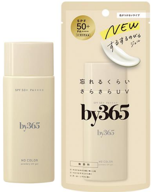
by365（バイサンロクゴ）パウダリー UV ジェル 価格：オープン価格 参考価格：990 円（税抜）1,089 円（税込） 容量：70 g お客様相談窓口：0120-32-4600

日焼け止めは、夏場や紫外線の強い時・場所のみで使用するものではなく、365 日毎日快適に使えることを目指してデビューした「by365」。今回のラインナップの増加で、さらに使用する人を選びやすさと使い分け易さを提供。スキンケアをするように毎日に寄り添い、UV カットに快適性を提供していきます。※ 1 アクリレツクロスポリマー-2-Na（吸着剤）