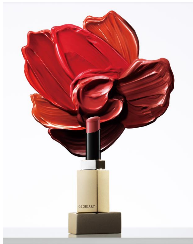
商品名：グロリアート ザ ルージュ（全 10 色）

「グロリアート ザ ルージュ」は、「花宵雲（はなよいぐも）」・「自惚染（うねぼれぞめ）」・「微酔想（ほろよいおもい）」など詩的な和名を持っています。その情景や心理を想像してしまうような名前をつけたのは、日本人女性のメイクに対する期待や憧れの気持ちを表すため。いくつになっても美しくありたい、自分らしくありたい、また今から変わってみたいという気持ちを大事にしているからです。いくつになっても持ち続けるドレッサーの前で口紅をひくときの、「さあ」という気持ちに寄り添って、顔印象と心を上向きにするアイテムになってほしいと願っています。