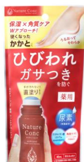
ネイチャーコンク 薬用 フットケアローション

「ネイチャーコンク」シリーズ全体の伸長に牽引されるようにここ数年で販売数量を伸ばしているのが「フットケアローション」。前年比 500%と伸長をしています。かかとケアアイテムのなかで、ローション状のアイテムは市場でも少ないオリジナリティのあるアイテムであるため、今後も認知拡大に努めたいと考えます。