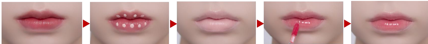
ヌードリップミューターの塗布イメージ