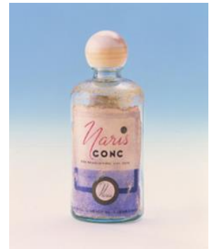
1937 年 ナリス化粧品 初のふきとり化粧水「コンク」

創業 5 年後の 1937 年に、研究職だった創業者の村岡満義が当社で初めて「ふきとり化粧水」を発売しました。余分な老化角質を取り除くことにより、肌のターンオーバーに働きかけ、後で使用する化粧品の浸透を高めることが目的であり、ふきとることが目的でなく、後で使用する化粧品の栄養を与えることが美肌にとって重要なことだと考えたようです。当時は「塗り重ねること」がスキンケアの常識であったため、常識を覆した商品として注目を浴びました。スキンケアで使用する「化粧水」は、洗顔の後に 1 品を使用することが一般的ですが、当社では洗顔の後に「ふきとり化粧水」を使用してから「化粧水」を使用するという 2 種類の化粧水を使用する独自の美容理論のもと商品を構成しています。当社は 1932 年の創業当時から社内に研究開発部門があり、角層研究は約 90 年に及びます。当社の調査では、ふきとり化粧水の認知率は 7 割を超え、美容に関心のある女性の 9 割超がふきとり化粧水を使用しており、美容意識の高い人に使用されているアイテムとして認知が広がっているようです。なお、当社は 2017 年にふきとり化粧水の国内販売シェア第 1 位を記念し、日本記念日協会に 2 月 10 日を「ふきとりの日」と申請し、認定されています。