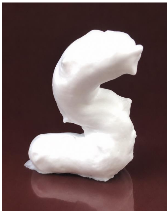
S字が自立するほどに高弾力な泡の研究品

今回特許登録に至った技術は、この泡の弾力と持続を実現するために以下の3つの方法を組み合わせています。まず1つ目は脂肪酸組成です。脂肪酸は濃度や組成の組み合わせによって洗浄力が変わりますが、これを最適化し、汚れは落としながら肌のうるおいは残す設計を見出しました。2つ目は、コアセルベーションの新技术です。コアセルベーションとは、洗浄後に肌を滑らかにする処方技術のことです。今回の処方では、特定のカチオン性高分子を最適なバランスで用いることで、これまでになく吸着力・滑らかさ・保湿感を付与することに成功しました。