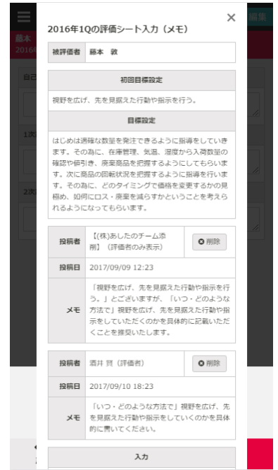
評価シートのメモ入力画面

「コンピテンシークラウド™」は、これまで紙やエクセルでの運用が一般的だった評価業務を Web 上で一括管理するクラウドサービスです。企業人事の評価業務で負担の大きかった期日管理や評価結果分析、査定シミュレーションの実施も可能で、工数の大幅削減を実現します。評価者のシステム操作ログを基に、評価の実施期日や入力内容を AI が自動的に解析し、評価者としてのスキルをレーティングする「評価モニタリング機能」も搭載しています。（2017 年 10 月 1 日より「コンピリーダー®」から名称変更となります。）