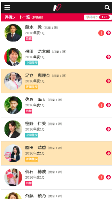
評価シート一覧画面

AI を活用した人事評価クラウドで中小企業の働き方改革をサポートする、株式会社あしたのチーム（本社：東京都中央区、代表取締役社長：高橋恭介、以下「あしたのチーム」）は、クラウド型人事評価システム『コンピテンシークラウド™』において、本日 2017 年 9 月 28 日よりスマートフォン（iPhone、Android）用ユーザーインターフェースを改定いたしました。