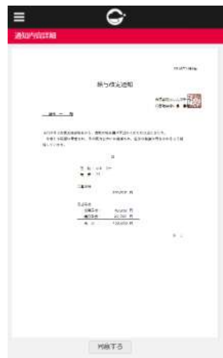
通知書詳細画面（左が PC、右がスマートフォン）