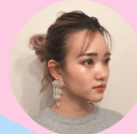
C CHANNEL 編集部 R.N

すでにある二重を強調するのに向いている商品。私の場合は、二重ファイバーで作った二重に使いました。二重ラインの端と端に細く引くと目の幅がぐんと広くなり、デカ目効果抜群。涙袋の影を作るのにもぴったりです。ミニマルなアイメイクがトレンドの今、こうやってパーツの輪郭をこっそり目立たせてくれるアイテムは重宝するべきかも。