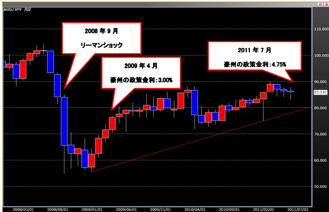
画面: 当社「Ex チャート」

投資家が豪ドルに注目する理由は、金利の高さが挙げられますが、その金利の動きが豪ドルの相場に影響を及ぼします。豪ドル/円の現在値は 85 円 93 銭近辺(2011/7/27 現在)ですが、相場を左右する金融政策には今後も注目が必要です。