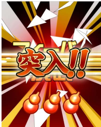
フィーバーゲージが溜まると突入！

本作の目玉『フィーバー演武』。画面上のボタンを間違えずにタップして、ダブルアップ形式でアイテムの入手が可能！ギリギリの線を見極めて魅力的なアイテムを大量獲得しよう！