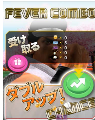
更にダブルアップで大量アイテムが！