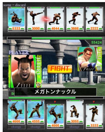
バトルの鍵はアーツの組み合わせ！