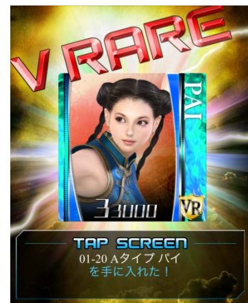
ご存知のキャラクターが勢ぞろい！