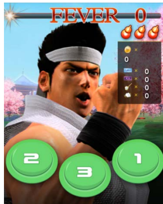
シンプルだが奥が深いシステム。