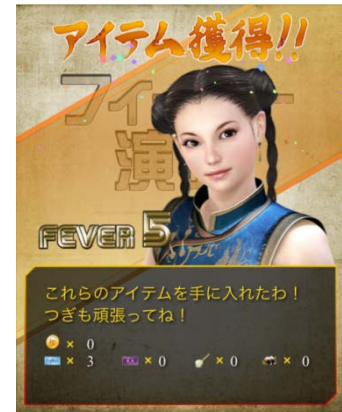
レアアイテムをゲットせよ！