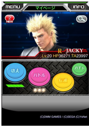
筐体を彷彿とさせるデザイン。

ゲームの流れは簡単。功夫(クエスト)でレベルを上げてアーツ(技)を入手。技を組み合わせることによりレベルが高いバトル相手でもチャンスが見出せるぞ！ジャイアントキリングを目指すのだ！