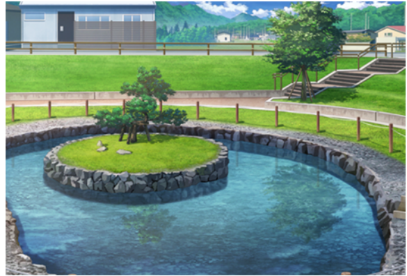
御社地公園