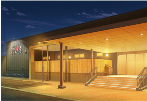
三陸四季湯彩 ますと乃湯