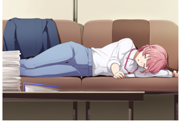
大槌みとらシーン