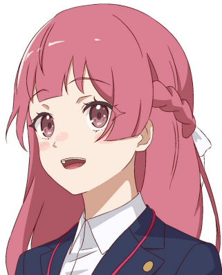
大槌みとら