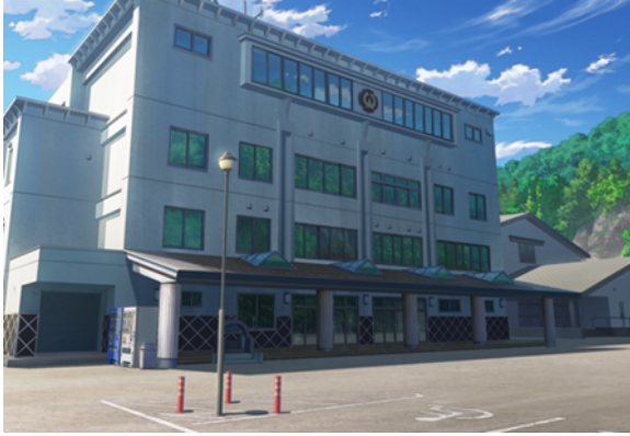
現在の大槌町役場