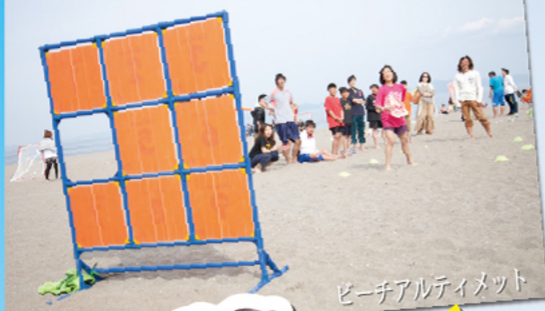
ビーチアルティメット

会場では、ステージ、BBQ、ビーチスポーツ体験、マリンスポーツ体験、アトラクション、ヒーリングなど6つのエリアに別れており、大人から子供まで1日中ビーチを楽しむ企画も盛りだくさん。日陰の休憩所やキッズスペースなども設けられているので、シニアや家族連れにも安心して楽しんで頂けます。