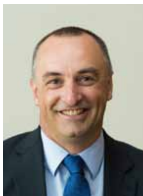
ドゥエーン・ケール副会長 (国際パラリンピック委員会)