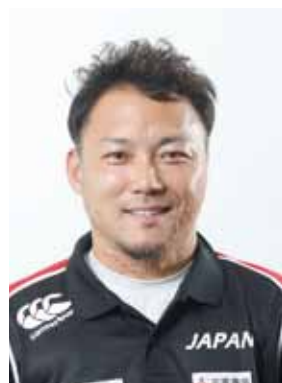
池透暢選手 (車いすラグビー日本代表)