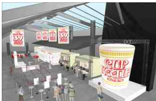
六本木ヒルズ O-YANE PLAZA での展開イメージ

・レギュラー ゆずこしょう、マスタード 他 ・カレー フライドガーリック、中濃ソース 他