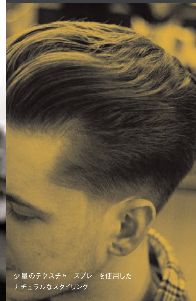
少量のテクスチャースプレーを使用した ナチュラルなスタイリング