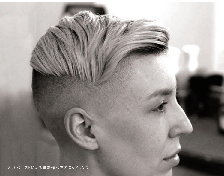
マットペーストによる無造作ヘアのスタイリング