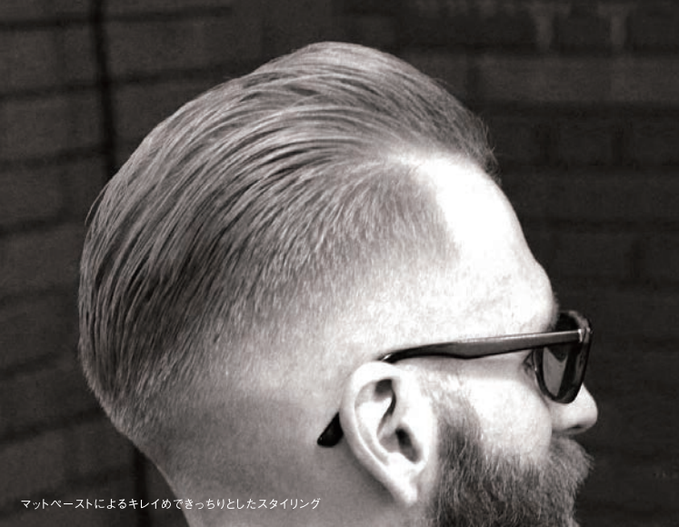
マットペーストによるキレイめでしっかりとしたスタイリング