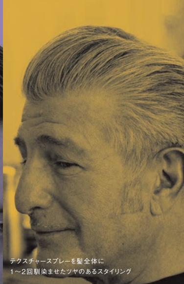
テクスチャースプレーを髪全体に 1~2回馴染ませたツヤのあるスタイリング