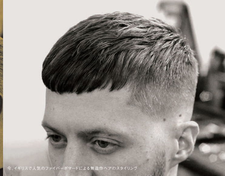
今、イギリスで人気のファイバーポマードによる無造作ヘアのスタイリング