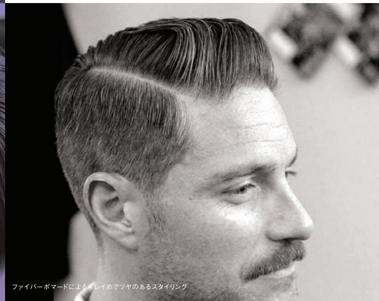
ファイバーポマードによるキレイめでツヤのあるスタイリング