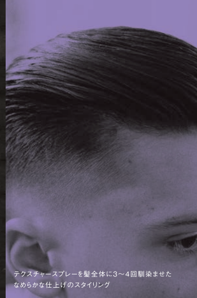
テクスチャースプレーを髪全体に3~4回馴染ませた なめらかな仕上げのスタイリング