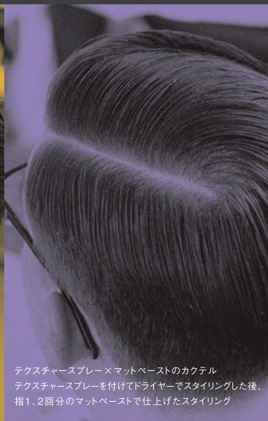
テクスチャースプレー×マットペーストのカクテル テクスチャースプレーを付けてドライヤーでスタイリングした後、 指1、2回分のマットペーストで仕上げたスタイリング