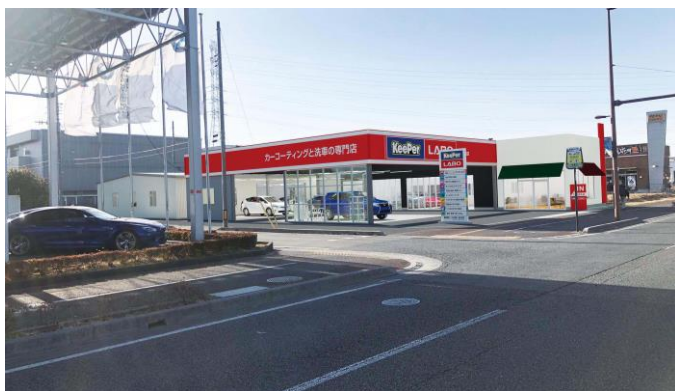
▲Keeper LABO 浦和美園店イメージ

関東地区は、既に「関東トレーニングセンター」（埼玉県三郷市）と「横浜トレーニングセンター」（神奈川県相模原市）がありますが、昨今、技術研修・検定会が増え、規模を大きくする必要があります。そこで埼玉県さいたま市にある、「Keeper LABO 浦和美園店」に隣接した形で、「埼玉トレーニングセンター」を開所することとなりました。