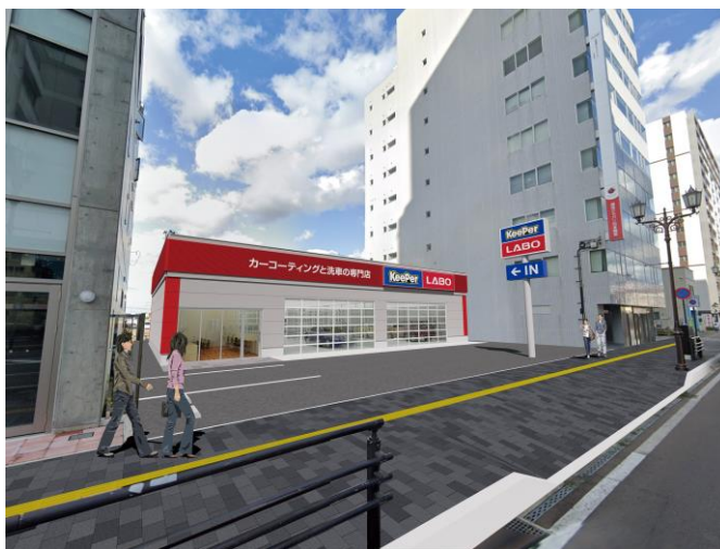
「Keeper LABO 弘前店」