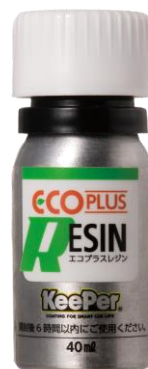
▲新製品「ECOプラスレジン」