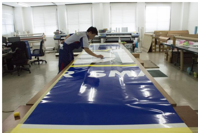
▲屋上看板 施工の様子

Keeperの大型屋上看板の設置場所は、都心環状線の名古屋市中区大井町付近です。視認性も良く、交通量の非常に多い場所に設置されるため、Keeperの看板を繰り返し見ることとなり、Keeperのブランディングに、大きな効果が期待出来そうです。