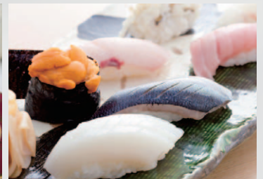
日本料理 水面《中之島プラザ12階》