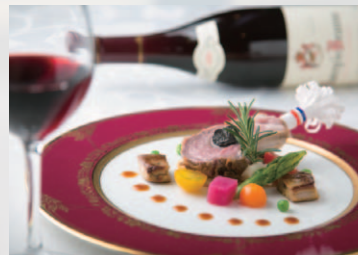
レストラン ルミエール 《中之島プラザ13階》