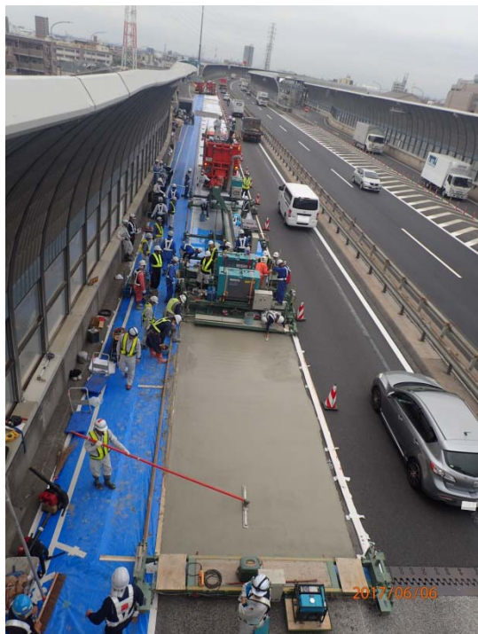
写真-1 鋼繊維補強コンクリート施工状況