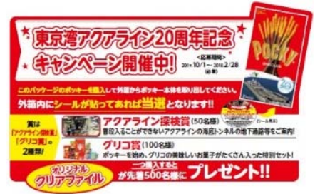
※画像はいずれもイメージとなります。

(2) 販売店舗にて記念ポッキーチョコレートを購入頂いた方に先着で「アクアライン 20 周年記念オリジナルクリアファイル」をプレゼントします。 ※無くなり次第終了となります。