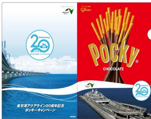
オリジナルクリアファイルイメージ

(2) 販売店舗にて記念ポッキーチョコレートを購入頂いた方に先着で「アクアライン 20 周年記念オリジナルクリアファイル」をプレゼントします。 ※無くなり次第終了となります。