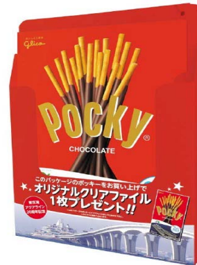
店舗設置イメージ