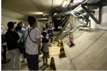
アクアライン探検賞

※プレゼントへのご応募は、当選シールをハガキに貼付し、必要事項を記載のうえ、当選シールに記載してある住所にお送りください。平成 30 年 2 月 28 日（水）必着となります。