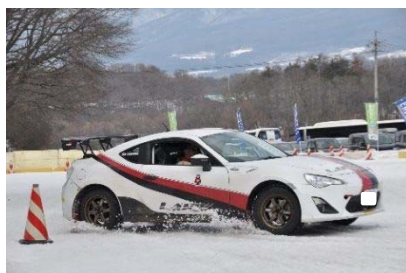
【インストラクターによるデモ走行】