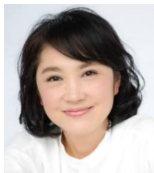
タレント 「よつばの会」代表 原千晶