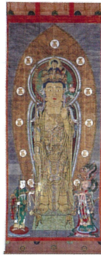
本尊十一面観世音菩薩御影大画軸(複製)