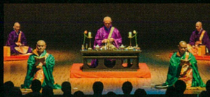
声明公演イメージ