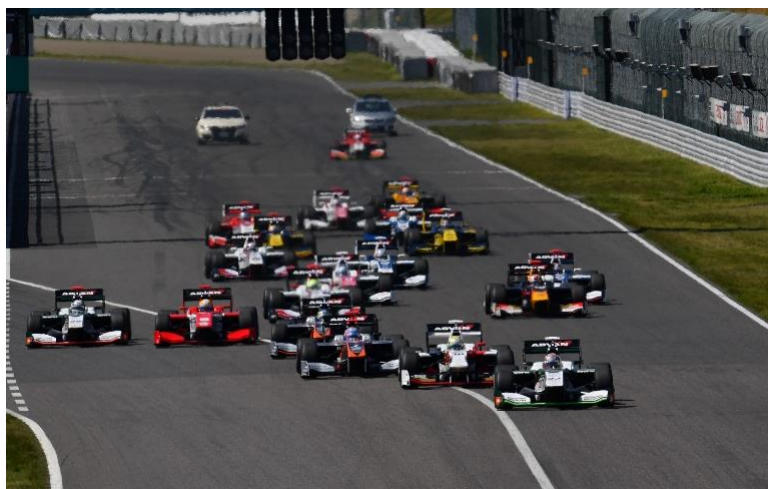
2017年開幕戦のスタートシーン(鈴鹿サーキット)