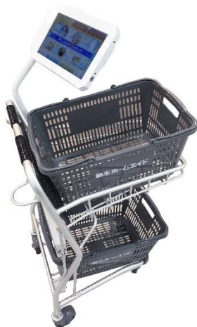
▲タブレット付きショッピングカート 「ショピモ」

ショッピングカートに取り付けられたタブレット端末を使い、限定クーポンや店内マップ、デジタルスタンプラリーゲームなどのコンテンツを店内に設置されたビーコンと連動しながら的確なタイミングでお客様に配信し、より便利で楽しく、お得なお買い物体験を提供します。これまでに、全国の累計5小売りチェーンで導入実績があります。