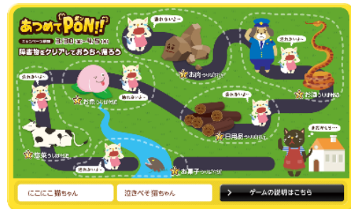
▲デジタルスタンプラリーゲーム