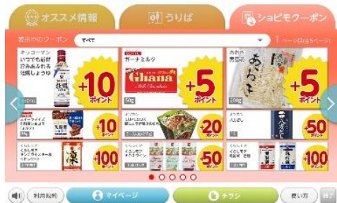
▲クーポン ※クーポンの内容はイメージです