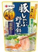
豚しゃぶ野菜鍋つゆ 豆乳仕立て 750g