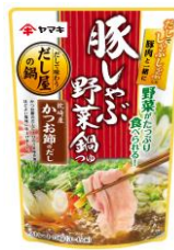
豚しゃぶ野菜鍋つゆ 750g