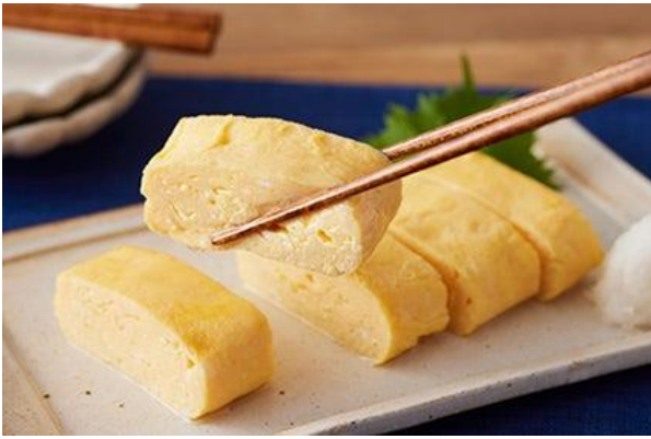
白だし だし巻き卵