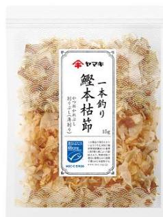
一本釣り鰹本枯節