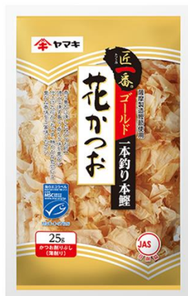
匠一番®薩摩産花かつおゴールド