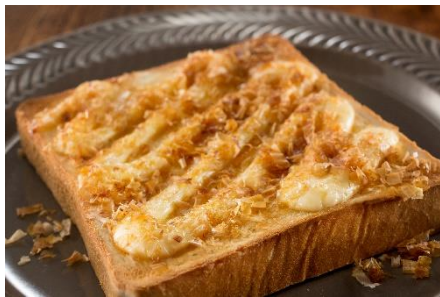
かつまよトースト

ヤマキいちおしの「かつまよトースト」、意外なおいしさの「かつお節アイス」など様々なメニューが取り上げられています。