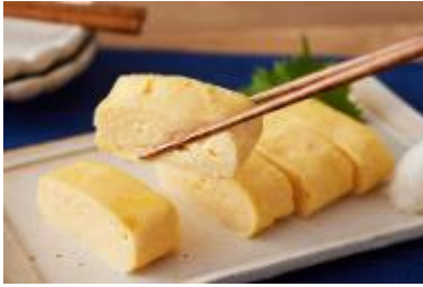
白だし だし巻き卵