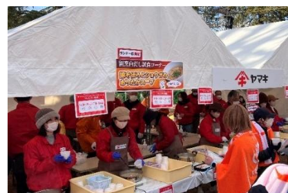
ヤマキブースの様子(第 62 回)