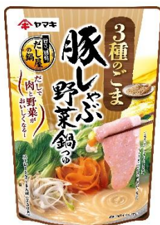
豚しゃぶ野菜鍋つゆ 3種のごま 750g