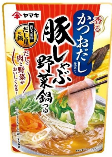
豚しゃぶ野菜鍋つゆかつお 750g

今回のリニューアルでは、だしの風味を向上し、肉や野菜のおいしさをより引き立てる味わいに仕上げました。また、シリーズ全体でパッケージデザインを見直し、商品の魅力をより分かりやすく伝えます。