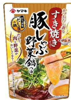
豚しゃぶ野菜鍋つゆ すき焼き仕立て 750g

ヤマキは、「鰹節屋・だし屋、ヤマキ。」として鰹節とだしを通じて、「おいしさ」と「健康」、そして「食文化の継承・食資源の持続性確保」に貢献してまいります。