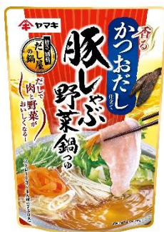
豚しゃぶ野菜鍋つゆ かつお 750g