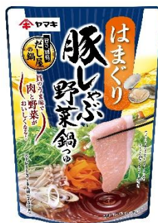
豚しゃぶ野菜鍋つゆ はまぐり 750g