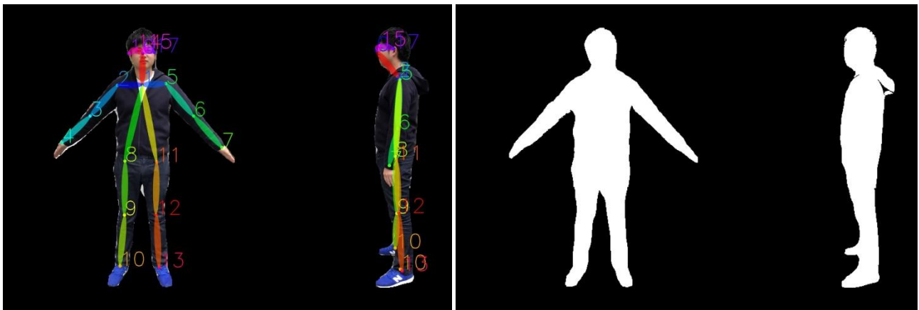
左：骨格測定イメージ 右：ボディライン抽出イメージ