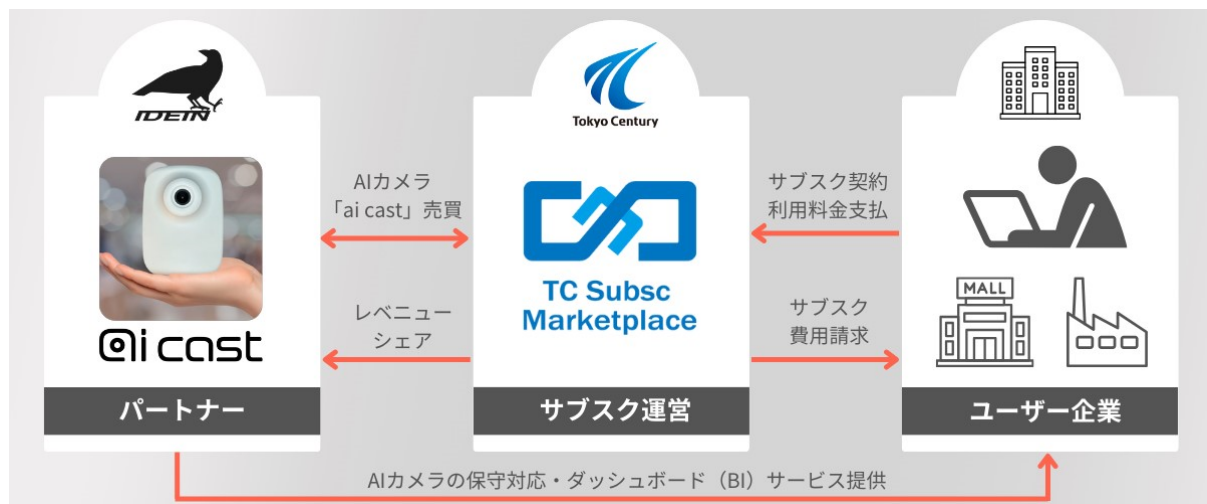
ai cast サブスクプランの提供スキーム

https://prtimes.jp/main/html/rd/p/000000056.000026271.html