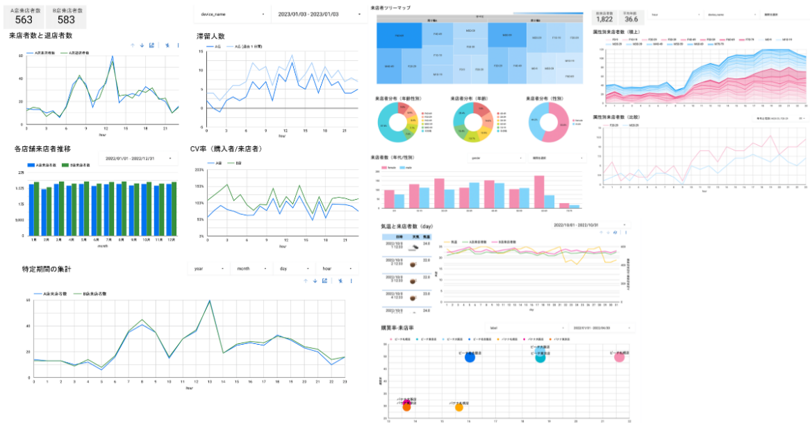
オプション提供のダッシュボード（イメージ）