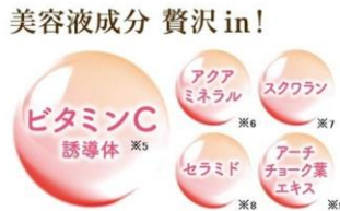
(当社調べ) 個人差があります