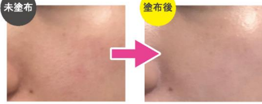
※ 仕上がりに個人差があります。