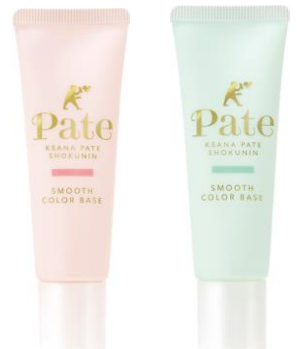
(左から) サナ 毛穴パテ職人 スムースカラーベース 01 (ナチュラルピンク) 22g 1,000円 (税抜) サナ 毛穴パテ職人 スムースカラーベース 02 (ミントグリーン) 22g 1,000円 (税抜)

02 ミントグリーン：透明感のあるナチュラルな肌に仕上げます。赤み・ニキビ跡が気になる方におすすめです。