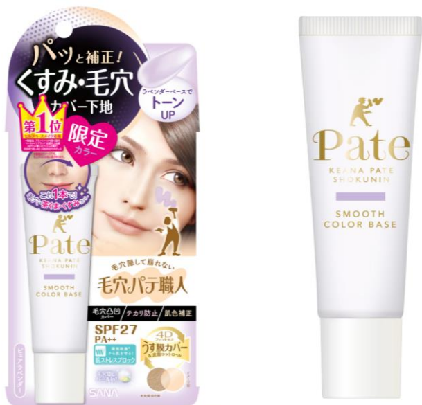
サナ 毛穴パテ職人 スムースカラーベース 03（ピュアラベンダー） 22g 1,000円（税抜）