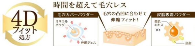
うす膜カバー & 皮脂コントロールでどんな毛穴も隠して崩しません。