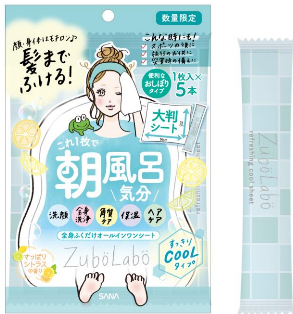
サナ ズボラボ 全身さっぱりシート（'21） 1枚入（10mL）×5本入 400円（税抜）