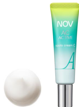
ノブ ACアクティブ スポッツクリーム C

美白：メラニンの生成を抑え、しみ・そばかすを防ぎます。 ※1 2-メタクリロイルオキシエチルホスホリルコリン・メタクリル酸ブチル共重合体液 ※2 dl-α-トコフェロール 2-L-アスコルビン酸リン酸ジエステルカリウム塩 ※3 L-アスコルビン酸 2-グルコシド