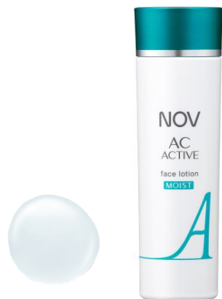
ノブ ACアクティブ フェイスローション モイスト